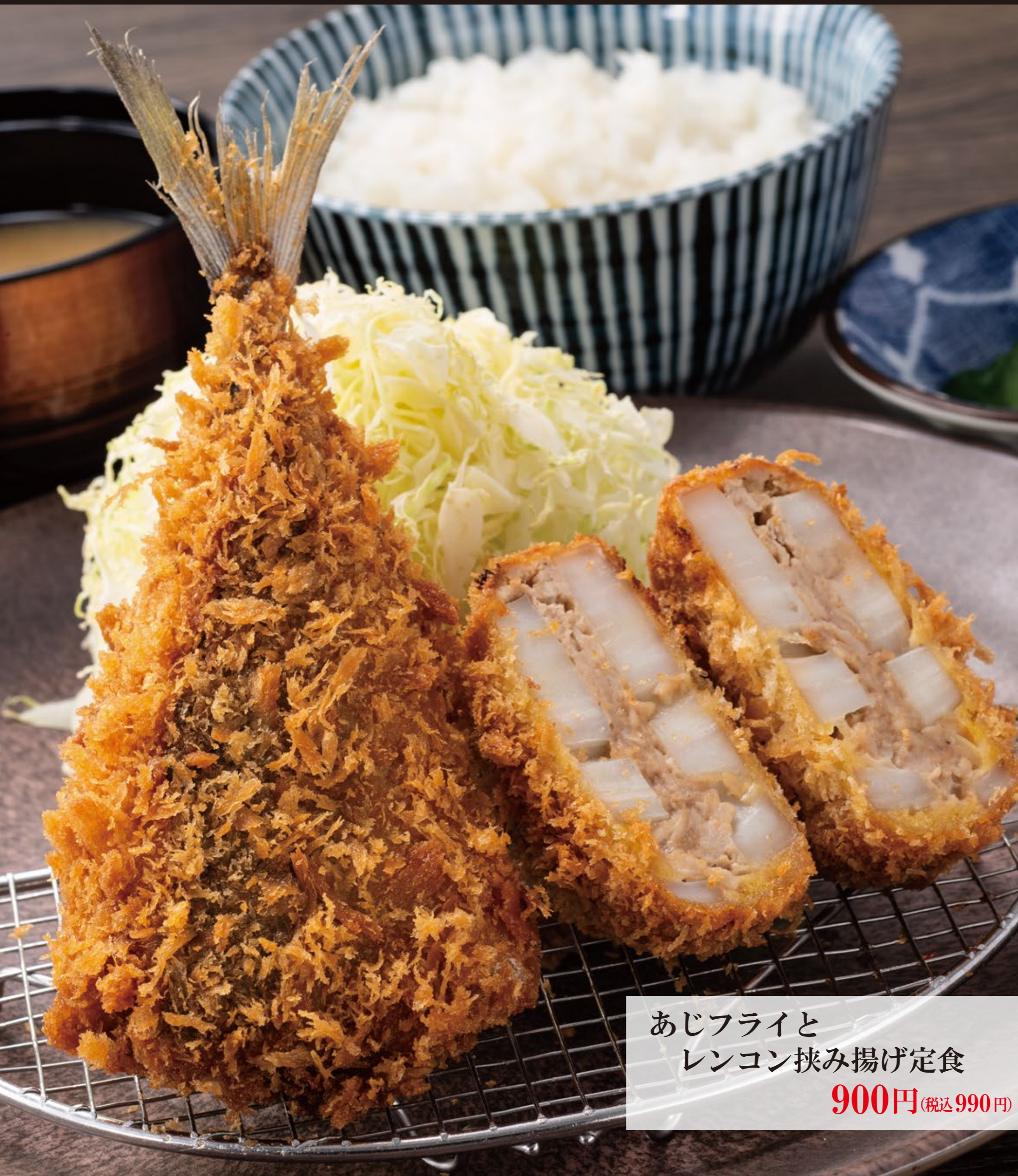
あじフライと レンコン挟み揚げ定食 900円 (税込990円)