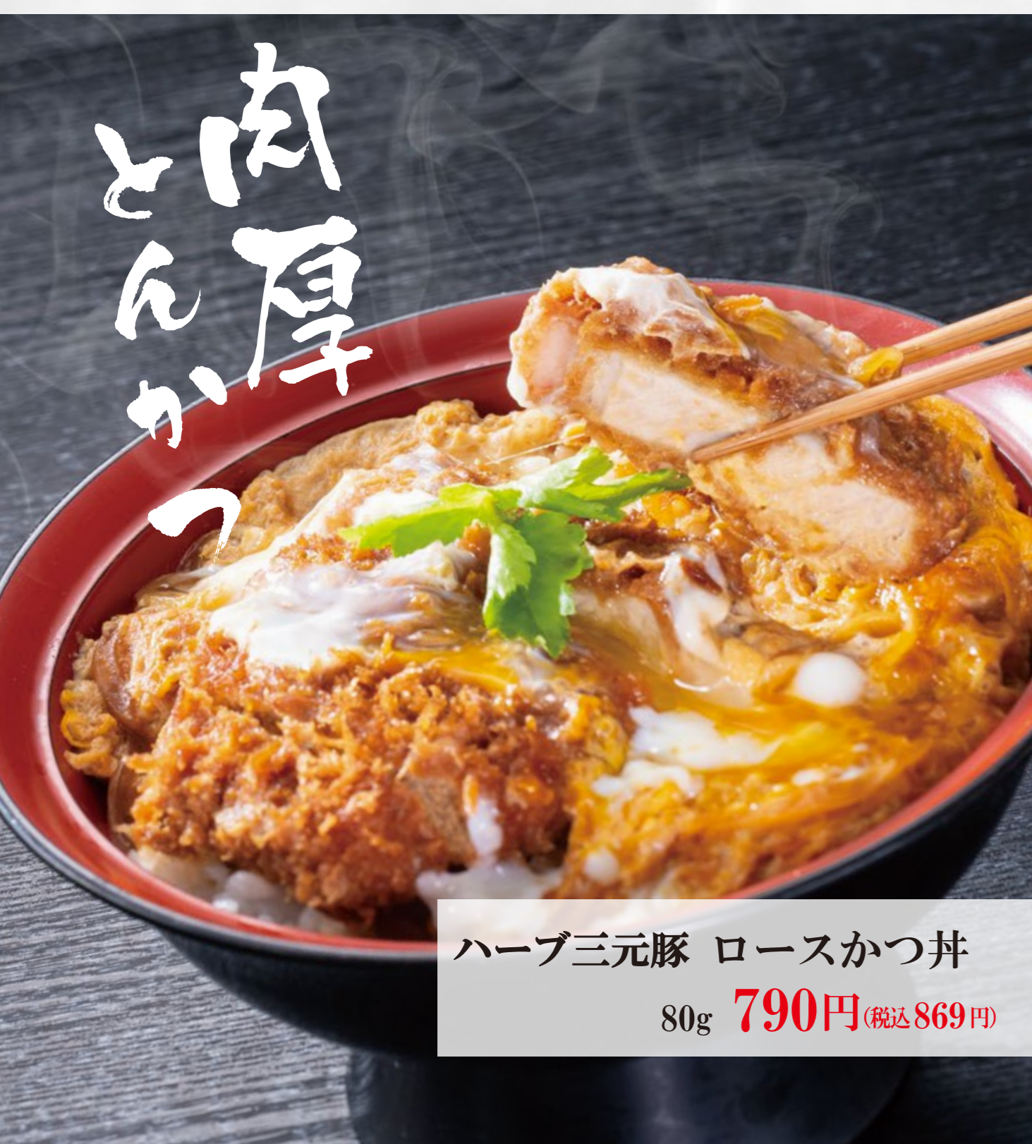
ハーブ三元豚 ロースかつ丼 80g 790円 (税込869円)