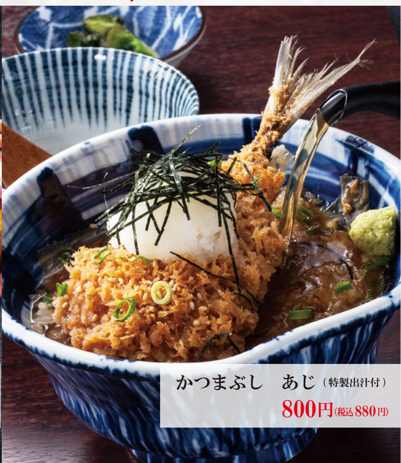
かつまぶし あじ(特製出汁付) 800円 (税込880円)