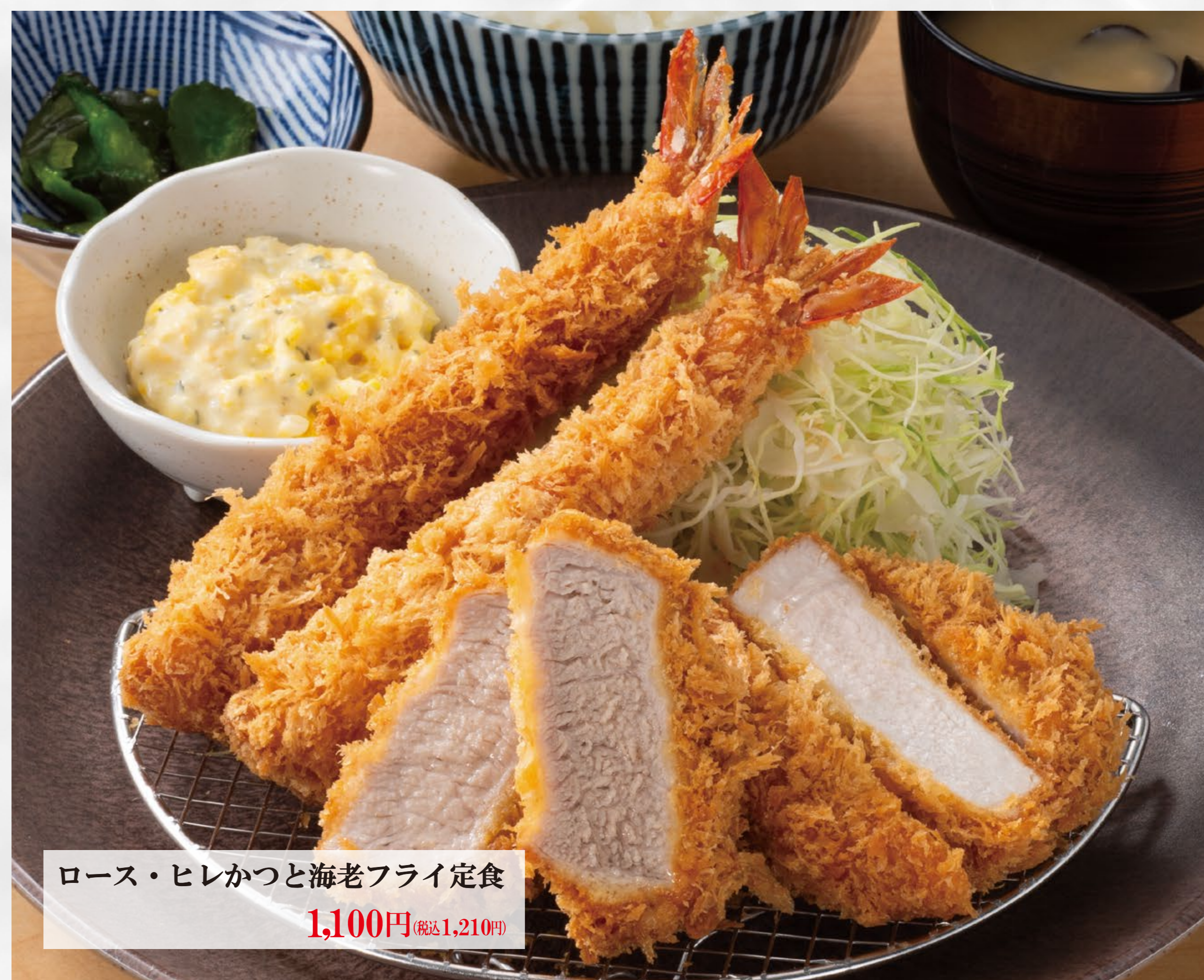
ローズ・ヒレかつと海老フライ定食 1,100円 (税込1,210円)